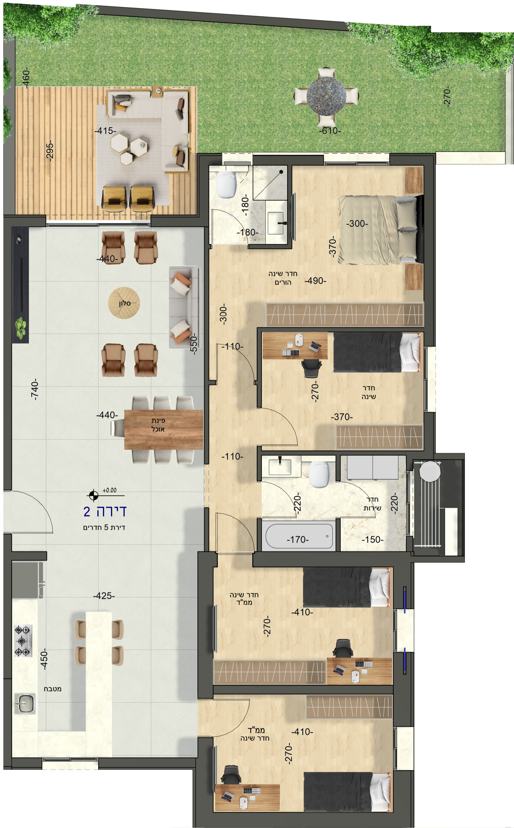
דירה 2 דירת 5 חדרים